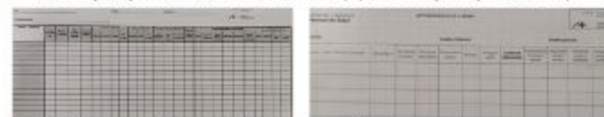
Figura 2. Libreta FRDIE REDAN-ISO (Cara de registro 1 y 2).

"Yo respeto, pienso que tanto si estás consumiendo en un sitio o en la calle, es el respeto, no te puedes poner pasado... si en un parque infantil. Pero de noche es más tranquilo con respeto puedes estar donde quieras. ¿no? (mejor).