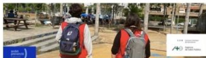
Figura 1. Equipo comunitario de Àmbit Prevenció realizando intervención en calle.

"Los salas de consumo se han hecho para que la gente, precisamente, no se pinche en la calle porque claro, aquí hay mucho gentío y muchos turistas y por la noche ¿qué? Incluso de noche se consume más que de día, esto es como un ambiente, no lo han pensado? (mejor).